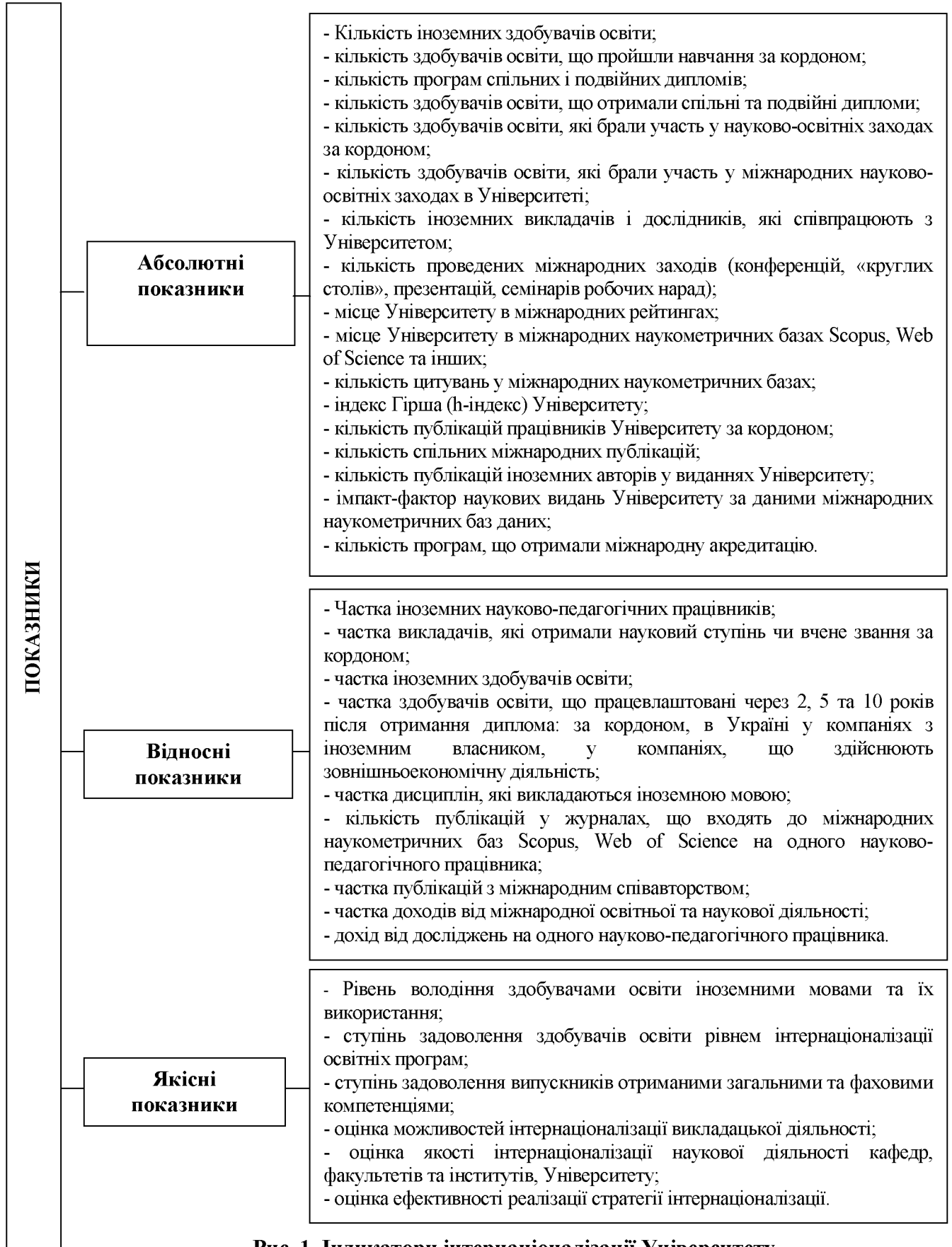
Рис. 1. Індикатори інтернаціоналізації Університету