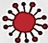
ПОЄДНАННЯ ВЛАСНОГО ТА ЗАПОЗИЧЕНОГО ТЕКСТУ БЕЗ ЦИТУВАННЯ ДЖЕРЕЛ