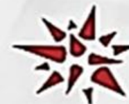
ЗГАДУВАННЯ ДЖЕРЕЛА БЕЗ ПОСИЛАННЯ