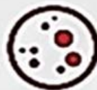
КОПІЮВАННЯ ЧУЖОЇ НАУКОВОЇ РОБОТИ ТА ПРИВЛАСНЕННЯ РЕЗУЛЬТАТІВ ПРАЦІ