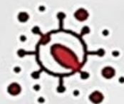
ВІДСУТНІСТЬ ПОСИЛАНЬ НА ПРЯМІ ЦИТАТИ