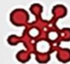
СПИСУВАННЯ ПИСЬМОВИХ РОБІТ ІНШИХ СТУДЕНТІВ