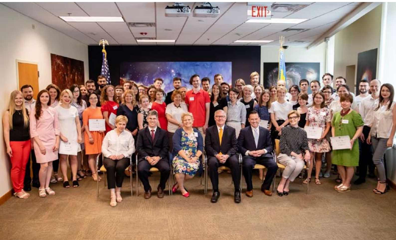
Передвиїзна орієнтація для учасників Програми імені Фулбрайта, Посольство США в Україні, 14 червня 2019